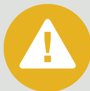
Produtos químicos e materiais perigosos